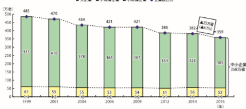
企業規模別企業数の推移

資料: 総務省「平成11年、13年、16年、18年事業所・企業統計調査」, 「平成21年、26年経済センサス-基礎調査」, 総務省・経済産業省「平成24年、28年経済センサス-活動調査」再編加工 (注) 1. 企業数=会社数+個人事業者数とする。 2. 経済センサスでは、商業・法人登記等の行政記録を活用して、事業所・企業の種別範囲を拡大しており、本社等の事業主が支所等の情報も一括して報告する本社等一括調査を実施しているため、「事業所・企業統計調査」による結果と単純に比較することは適切ではありません。